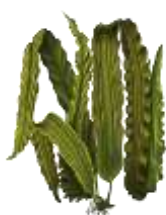
4. Ламинария японская