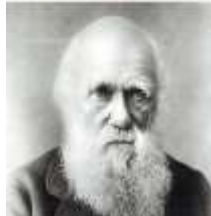
2. Ч. Дарвин