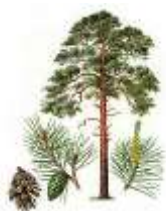
1. Сосна обыкновенная