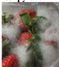
2. Белая плесень