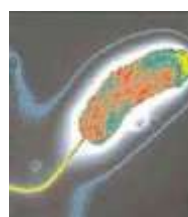
5. Холерный вибрион