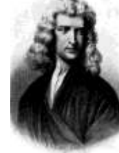
4. И. Ньютон