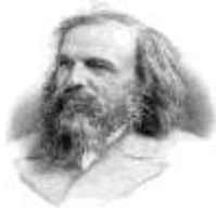
1. Д.И. Менделеев

2. Выберите фамилии учёных, которые внесли вклад в развитие биологии