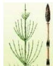
3. Хвощ полевой