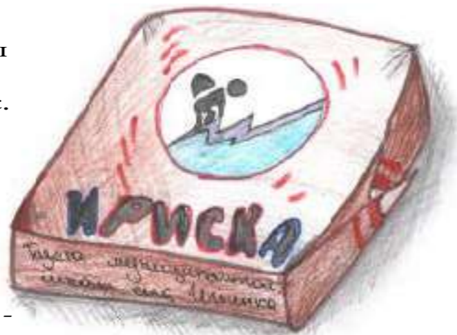
Рыбникова Анастасия 10 кл